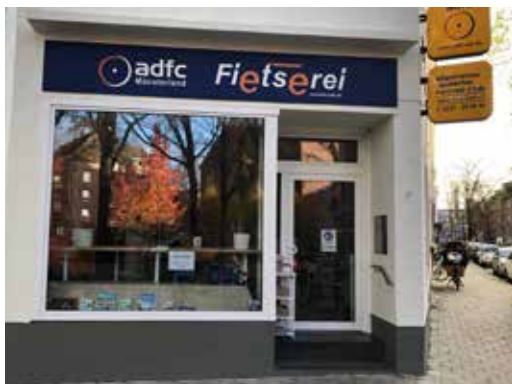
Infoladen ADFC Kreisverband Münsterland e.V.

Mit fahrradfreundlichen Grüßen - Ihre Redaktion