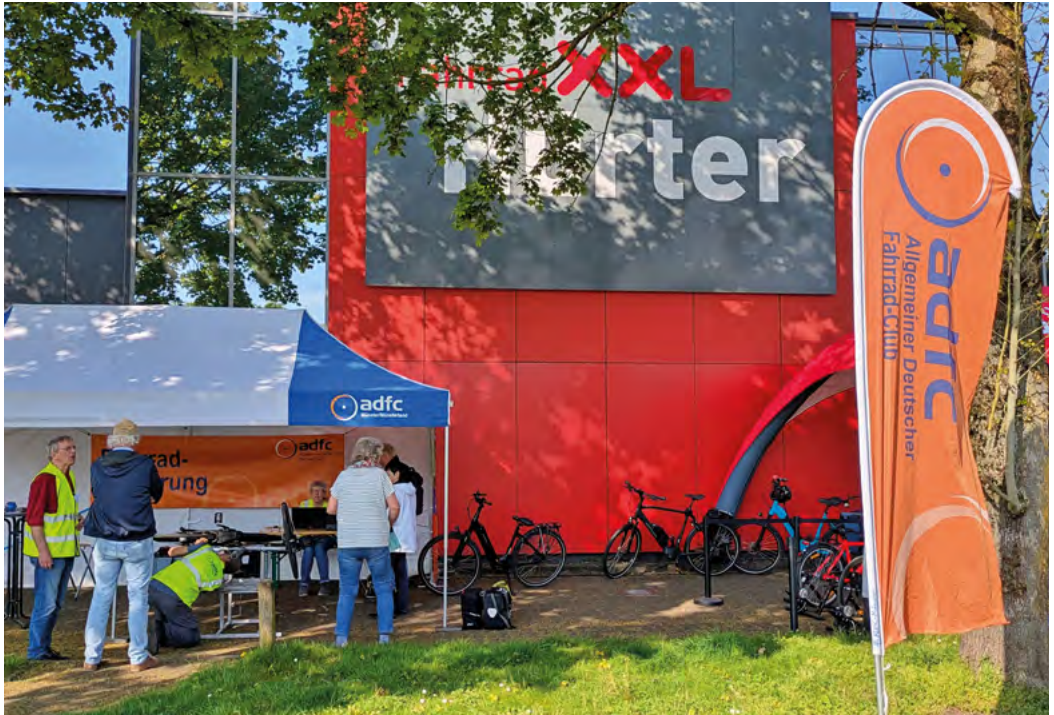
Schöner Platz an der Sonne

Ein codiertes Fahrrad ist in Deutschland schwerer zu verkaufen, wenn die Codierung nicht zu den Anbietenden passt. Selbst wenn der Code weggeschliffen wird, lässt er sich noch immer per Infrarot im verdichteten Material auslesen.