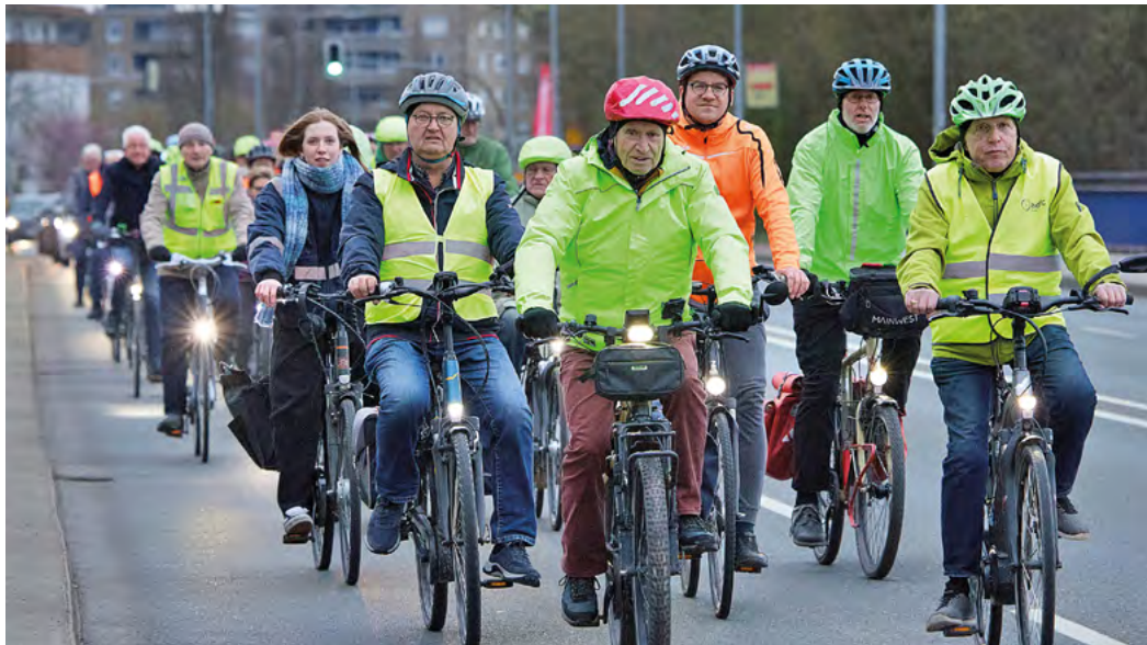
Rege Beteiligung bei der Critical Mass-Rundfahrt