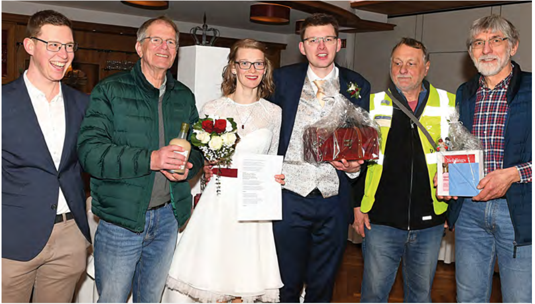
Brautpaar der Woche

nahm das frisch vermählte Paar eine Wanderung auf dem Töttenweg, der von Holland über Bad Bentheim nach Steinbeck führt. Wir vom ADFC