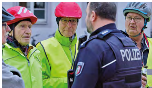
Dialog mit der Polizei

Zur Information: § 27 der StVO erlaubt die Bildung eines sogenannten Fahrrad-Verbandes ab 16 Rad Fahrenden. Dann dürfen sie zu zweit nebeneinander auf der Fahrbahn fahren. Der Verband wird rechtlich wie ein einziges großes Fahrzeug behandelt. Daher gilt z. B. bei ampelgeregelten Kreuzungen: Wenn der erste Radfahrende bei grünem Licht die Haltelinie überfährt, dürfen ihm alle anderen folgen, auch wenn die Ampel auf Rot umschaltet (siehe dazu auch den Artikel „Radfahren in Gruppen“ in dieser Ausgabe).