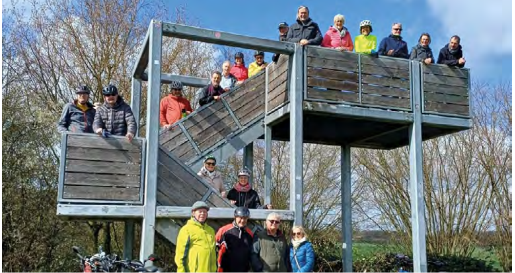
Am Zechenbahnradweg in der Frühlingssonne

Bis zu 7000 Beschäftigte hatte der Bergbau in Ahlen auf der Zeche „Westfalen“; die Kohleförderung wurde im Jahr 2000 eingestellt. Der Ahlener Bergbautraditionsverein pflegt jedoch die Geschichte des Ahlener Bergbaus und hat u. a. die „Zechenrunde“ konzipiert. Auf einer Strecke von 39 Kilometern führt sie zu 8 Standorten des ehemaligen Bergbaus. Die Tour startet an den imposanten Gebäuden der Zeche, die jetzt von verschiedenen Gewerben genutzt werden. Sie