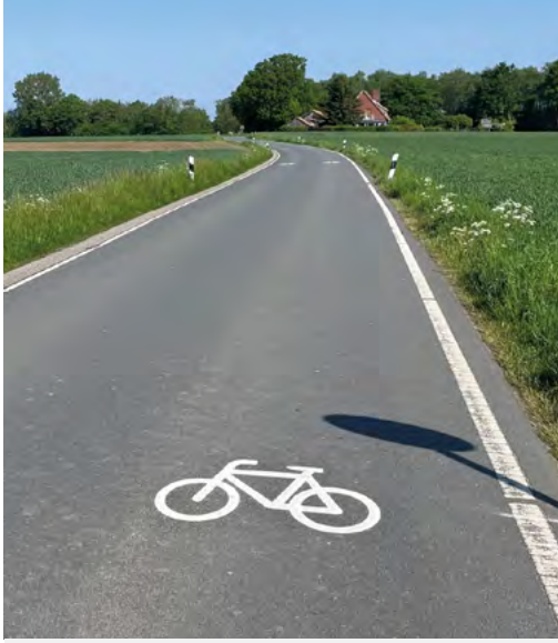
Fahrrad-Piktogramme Alter Mühlenweg

Die Stadt Münster hat auf der Fahrbahn des Alten Mühlenwegs zwischen Handorf und Wolbeck Fahrrad-Piktogramme aufbringen lassen. Die Piktogramm-Kette auf einer Strecke von knapp vier Kilometern weist seit Mitte März alle Verkehrsteilnehmenden deutlich darauf hin, dass auf dem Teilstück viele Radfahrerinnen und Radfahrer unterwegs sind und schafft mehr Aufmerksamkeit für den Radverkehr.