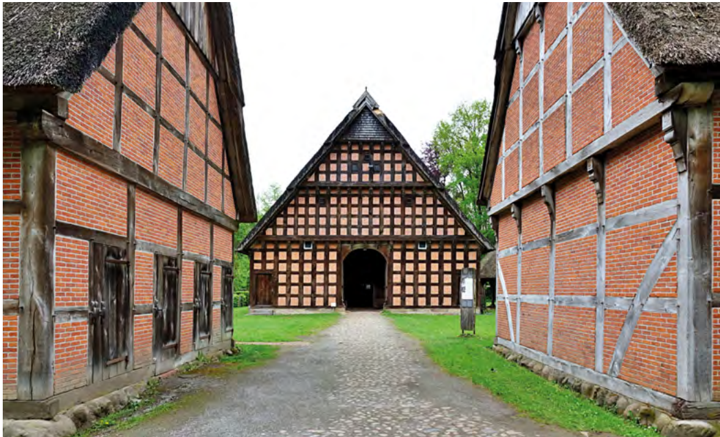
Prachtvolle niedersächsische Hofanlagen zeigt das Museumsdorf Cloppenburg

So radelte die 15-köpfige Gruppe zunächst von Papenburg mit seinen langen und schnurgeraden Kanälen durch den Naturpark Hümmling, der von weiten Moor- und Geestlandschaften geprägt ist. Ein besonderes Highlight des ersten Tages war der Aufenthalt an der sternförmigen Anlage von Schloss Clemenswerth, bevor man dann zur Übernachtung in Lönningen an der Hase einkehrte.