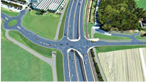
Ausbauplan der Handorfer Kreuzung

Am 27. April lud die Bürgerinitiative B 51 Handorf-Mauritz e.V. (BI) zur Informationsveranstaltung in Handorf ein. Über 150 besorgte Menschen folgten der Einladung. Kurz und kenntnisreich informierten die Aktiven der Bürgerinitiative die Teilnehmenden über die derzeitigen Ausbaupläne von Straßen.NRW. So mussten wir erfahren, dass Bundesverkehrsminister Volker Wissing (FDP) noch kurz vor dem Ende der Ampelregierung den Landesverkehrsminister Oliver Krischer (GRÜNE) anwies, das Planfeststellungsverfahren für den Ausbauabschnitt von Mauritz bis Handorf nach dem Bundesverkehrswegeplan (siehe besonderen Kasten) einzuleiten. Auf diesen 2,5 Kilometern soll mit vielen Millionen ein autobahnähnlicher Ausbau entstehen, der an Gigantismus nicht mehr zu überbieten ist (siehe Bild).