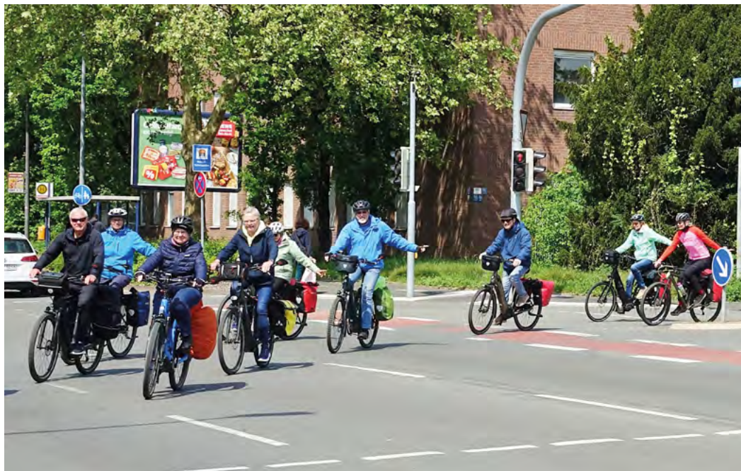
Die Gruppe ist als Verband erkennbar, könnte aber noch disziplinierter und kompakter fahren.

heriger Einweisung oder für Gruppen, die entsprechend geübt darin sind.