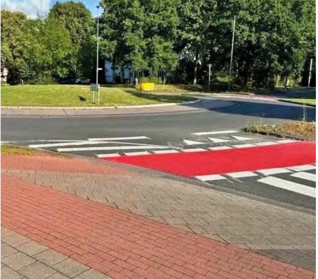
Kreisverkehre sicherer gestalten

Hier spielt mutmaßlich die Autolobby wieder eine große Rolle, der es nach wie vor um die Schnelligkeit des Autoverkehrs und nicht um die Sicherheit zuerst geht.