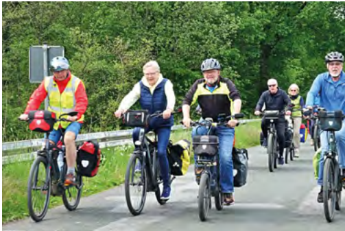
Die Gruppentour in breiter Front – so sollte man es besser nicht machen

Zwei Dinge sind hier besonders wichtig. Zum einen sollte natürlich durch Handzeichen oder – falls Fahrzeuge sich von hinten nähern – durch Zurufe frühzeitig Aufmerksamkeit erzeugt werden. Zum anderen ist häufig zu beobachten, dass bei erkennbarem Gegenverkehr die vorne fahrenden Gruppenmitglieder unvermittelt abbremsen. Das ist jedoch keine gute Idee, da ein rasches Einscheren für den Rest der Gruppe dadurch faktisch unmöglich gemacht wird. Deshalb mein Rat: Bei Gegenverkehr vorne etwas schneller fahren, dann entsteht Platz, der hinten dringend benötigt wird.