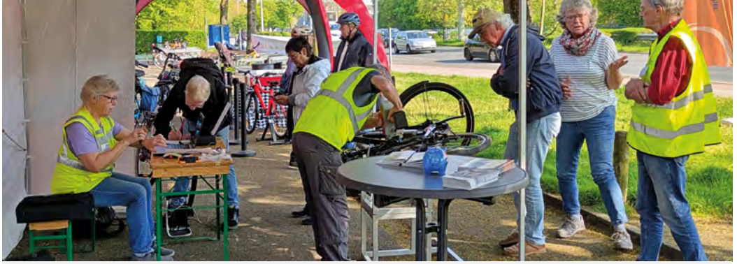
Der Stand war meist gut besucht