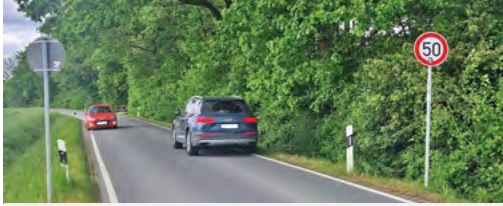
Begegnungsverkehr Thierstraße

Für den Bereich Thierstraße stellte die Stadt drei Vorschläge vor. Der ADFC positioniert sich eindeutig für eine durchgehende Fahrradstraße und lehnt den Neubau eines separaten Radwegs ab.