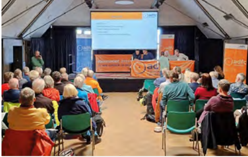
Mitgliederversammlung 2026 im Bennohaus