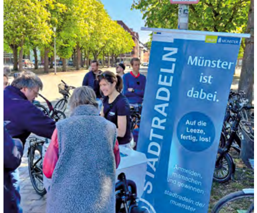
Impressionen der diesjährigen STADTRADELN-Auftakttour