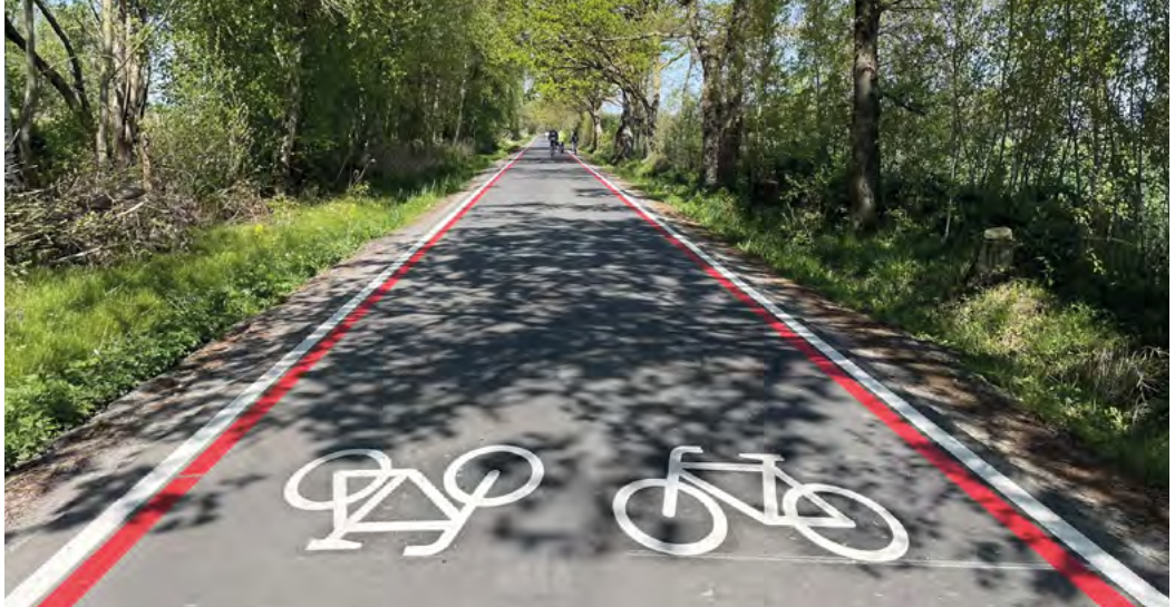
Ein roter Begleitstrich wie hier auf dem Hessenweg kennzeichnet in Münster eine „Fahrradstraßen Basis“

Die Zahl der Fahrradstraßen in Münster wächst weiter: Seit kurzem sind Teile des Hessenwegs in Höhe der Rieselfelder und der Kötterstraße östlich von Handorf Münsters 16. und 17. Fahrradstraße nach neuen Qualitätsstandards. Erstmals im Stadtgebiet entstehen dabei sogenannte „Fahrradstraßen Basis“.