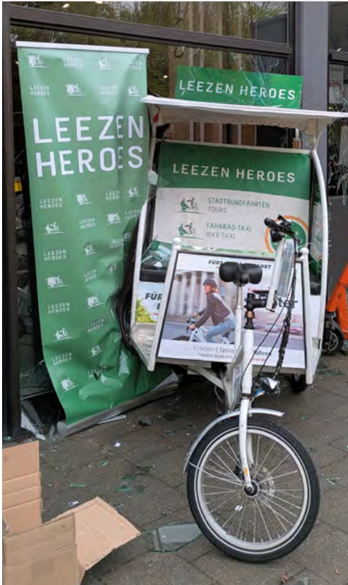
Die Rikscha mit zwei zerbrochenen Scheiben

Am 17. April codierte die ADFC-Ortsgruppe Münster bei ihrem langjährigen Fördermitglied Fahrrad XXL Hürter von 10 bis 19 Uhr anlässlich des Frühlingsfestes 40 Fahrräder gegen Diebstahl. Dabei gab es viele interessante Kontakte, Gespräche und auch Menschen, die dem ADFC beitraten.