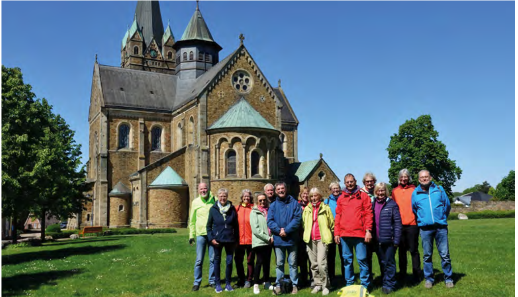
Strahlender Sonnenschein in Ankum vor dem Artländer Dom

Bereits zum vierten Mal fand die „Brieftaubentour“ der ADFC-Ortsgruppe Sendenhorst in diesem Jahr statt. Darunter versteht man eine Radreise, deren Startpunkt vorher geheim bleibt. Wie eine Schar Brieftauben wird die Reisegruppe zu einem Ort gebracht, von dem aus dann die Reise in die Heimat zurückführt – ein Konzept, das vor allem auch wegen des Überraschungsmomentes inzwischen gute Resonanz gefunden hat.