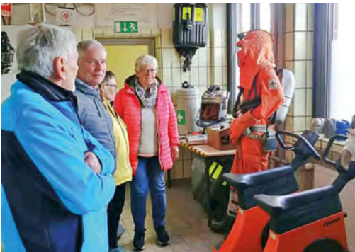
Das Grubenwehnmuseum zeigt die gefährliche Arbeit unter Tage

führt zunächst über den Werseradweg zu einem ehemaligen Wetterschacht und über den Zechenbahnradweg zum Kanalhafen in Hamm, wo die Kohle verladen wurde. Imposant ist auf dem Enniger Berg die große Brache des Schachtes VII, der noch 1981 in Betrieb genommen, jedoch bereits im Jahr 2000 wieder geschlossen wurde. Ganz andere Aspekte des Bergbaus stellen das Denkmal zur Erinnerung an den Arbeiterdichter Herbert Berger und das Ehrengrab auf dem Westfriedhof zur Erinnerung an das größte Bergwerksunglück Ahlens dar, bei dem im Jahr 1920 14 Bergleute ums Leben kamen.