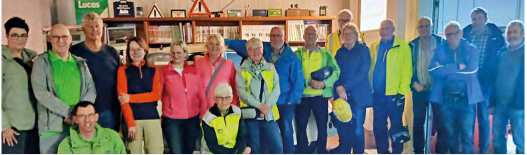
Die Besuchergruppe im Museum

Da fast alle Radfahrenden auch Auto fahren, kann die Frage, ob Auto und Fahrrad zusammengehen, mit einem Ja beantwortet werden. Bei vernünftigem und sinnvollem Umgang kann das Auto ein nützlicher Helfer sein. Deshalb konnten sich die Teilnehmenden der Saisonauftakttour der Ortsgruppe Billerbeck auch mit gutem Gewissen zum Oldtimermuseum der Familie Klopfer nach Nottuln begeben. Auch passionierte Radfahrerinnen und Radfahrer sind immer wieder fasziniert, mit wie viel Liebe zum Detail alte Autos für den Gebrauch im Straßenverkehr restauriert werden. Das Museum ist eine