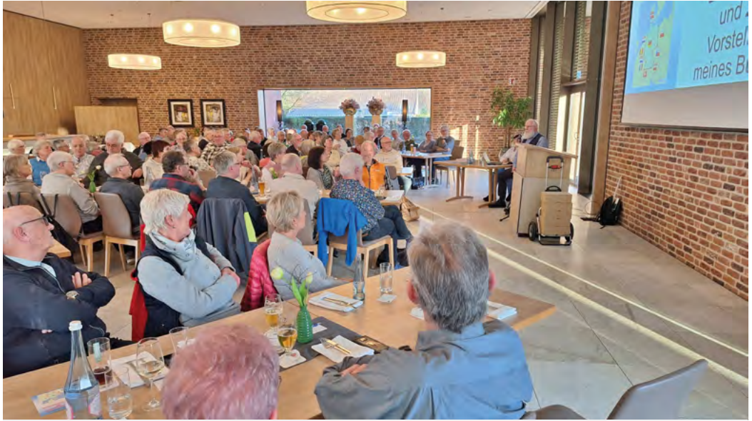
Teilnahme bei der Vorstellung