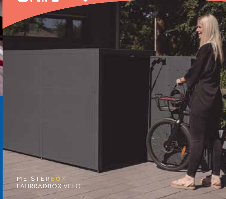
MEISTERBOX FAHRRADBOX VELO